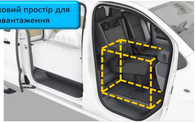
Додатковий простір для завантаження